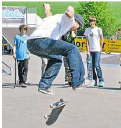
Nach der Einweihung gab es so manchen Skatertrick zu bestaunen.

FREIZEIT Die Anlage wurde am Samstag offiziell eingeweiht und den Jugendlichen übergeben. Diese zeigten gleich erste Tricks auf dem Skateboard.